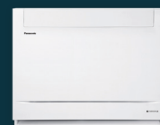
Floor Inne del