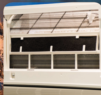
Aktivt kull filter